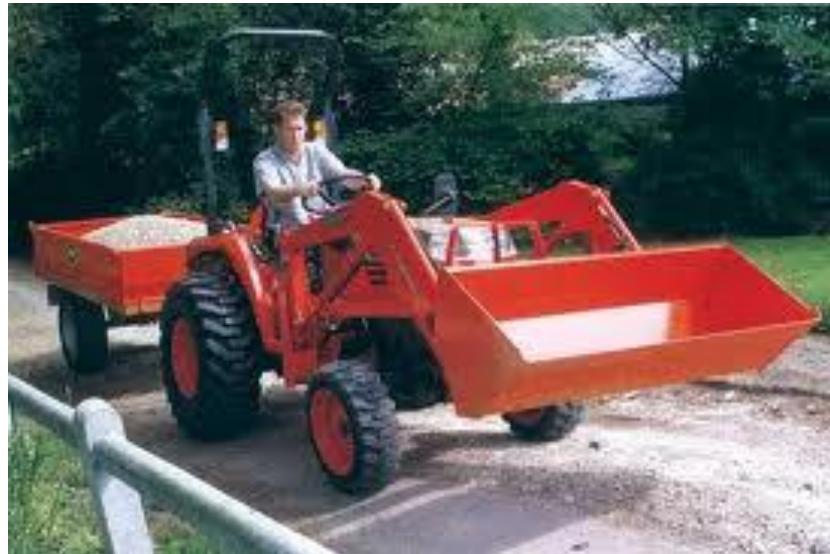
מכשירי תנועה ומכונות (2004) בע"מ_ מעמיס קדמי לקובוטה STV40